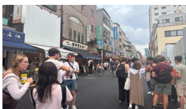
図3 計画対象地の調査