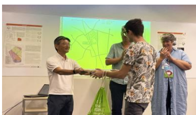
図5 修了証書の授与