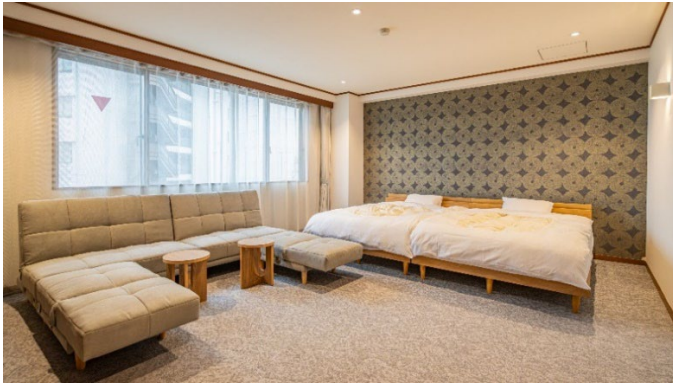
▲宿泊部屋（洋室タイプ）